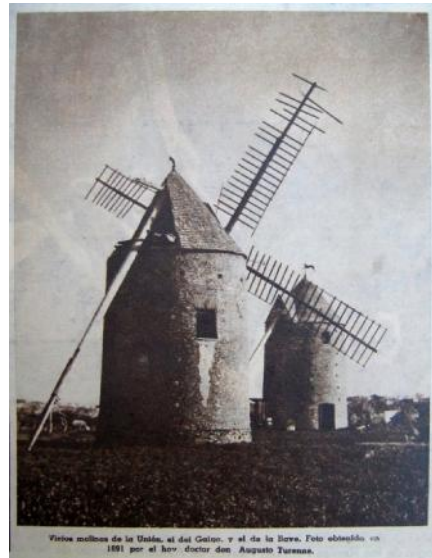
Varios molinos de la Unión, el del Galgo, y el de la Llave.

De los molinos molondros podía llamarse a éste el rey, aunque dependiese siempre de los caprichos del viento». Hoy el Molino del Galgo es el emblema de un proyecto social, cultural y deportivo que funciona con apoyo económico e institucional de la Intendencia de Montevideo.