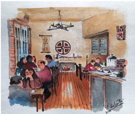
Acuarela de Álvaro Saralegui Rosé

El café y chocolatería Nudo Escudo es un buen ejemplo de ellos, además de una invitación para entrar en el mundo de la tradición Vikinga.