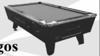
POOL AMERICANO TRAGA MONEDAS