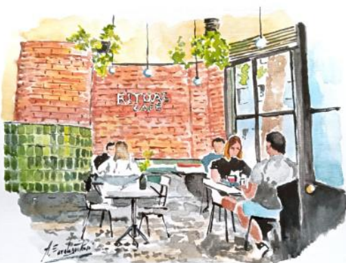
Acuarela de Álvaro Saralegui Rosé